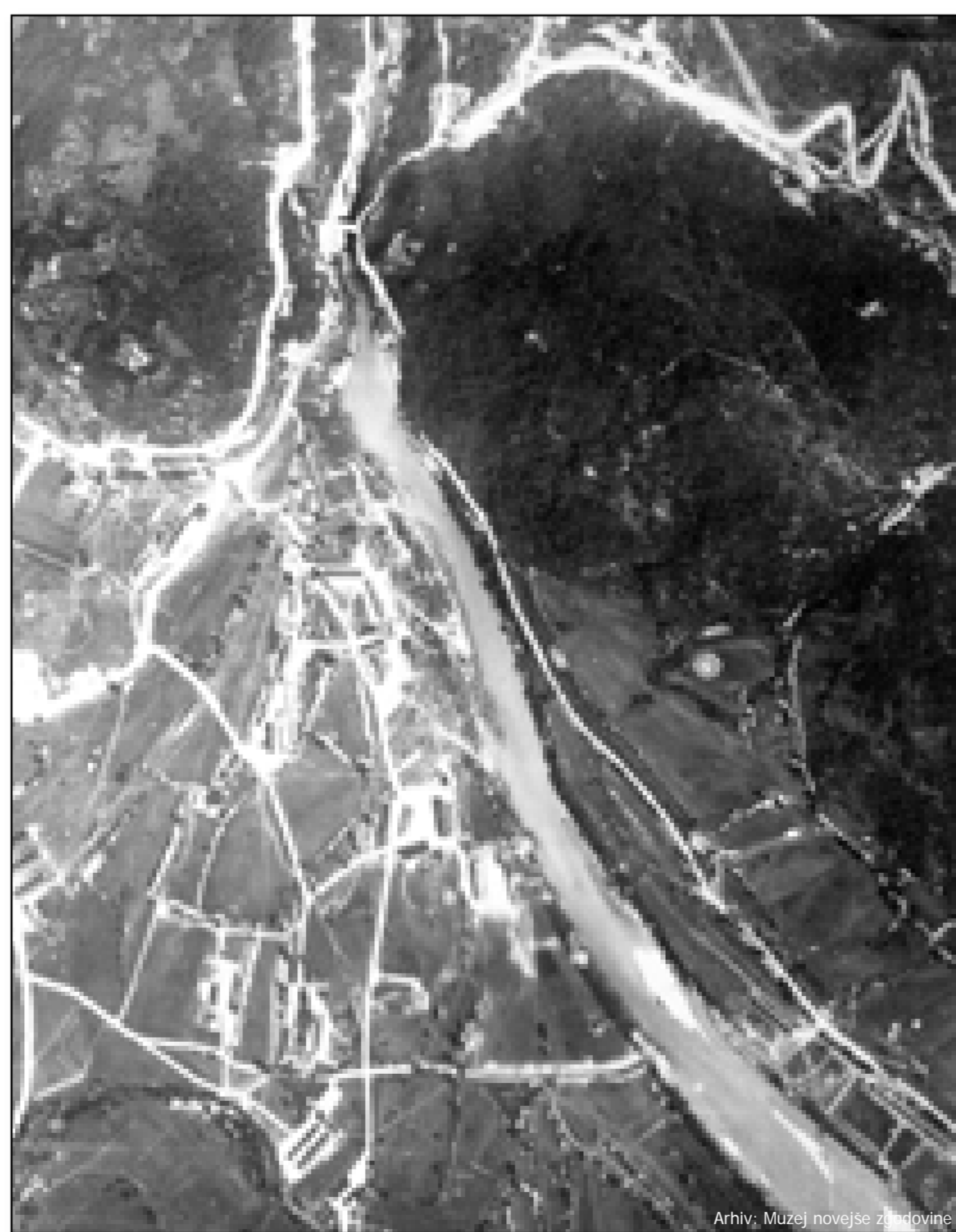
Na Logu med prvo svetovno vojno.